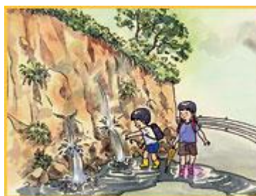
がけから水が湧き出ている。