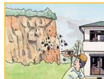
がけから小石がぱらぱらと落ちてくる。