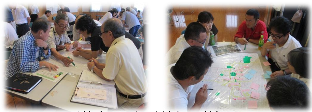
災害図上訓練の様子

また、3月上旬の火災予防週間にあわせて、防災事例集の回覧や、三国小校区の防災マップの作成に取り組みました。