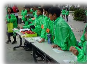
(三国中テニス部ボランティア)

運営に携わって頂きました三国中学校、のぞみが丘小学校の育成会の皆様をはじめ、協力頂いた皆様、ありがとうございました。