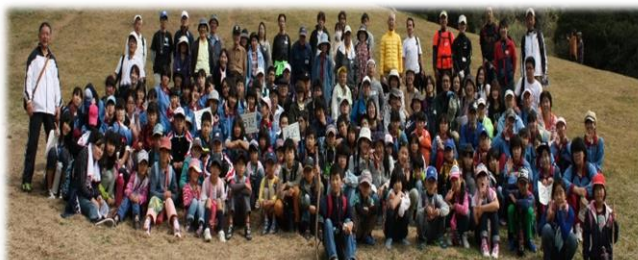
青少年育成部会（基山登山）