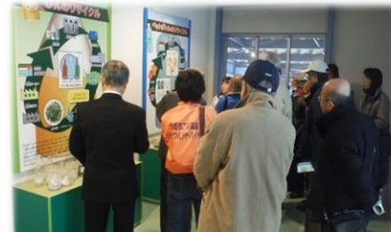
環境衛生部会（視察研修）