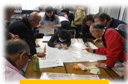
防災部会（図上訓練）