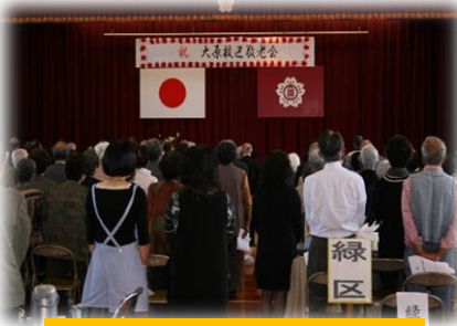
健康福祉部会（敬老会）