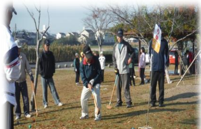
スポーツ部会（Gゴルフ大会）