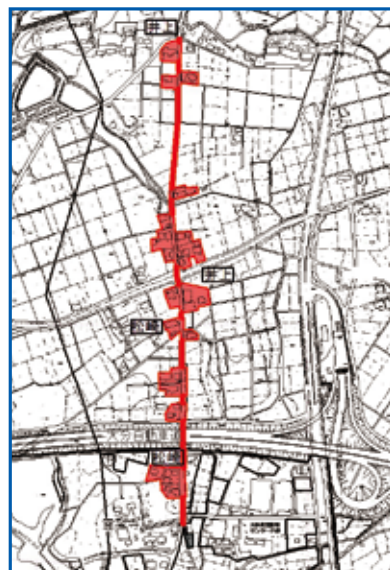
新たに下水道を使用できる区域 既存の下水道を使用できる区域