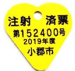
▲鑑札(左)と注射済票(右)