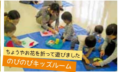
ちょうやお花を折って遊びました のびのびキッズルーム