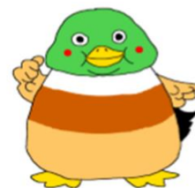
けんしんマスコット・カモん君