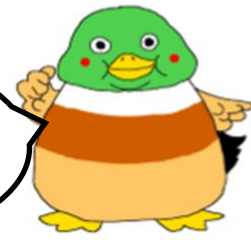
けんしんマスコット・カモン君