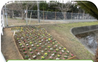
花壇設置（環境・衛生部会）