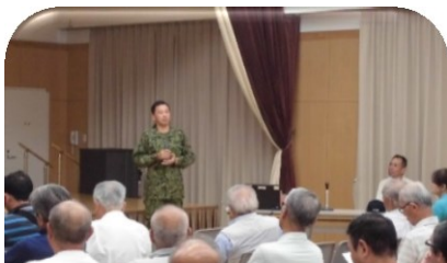
防災講話（校区自主防災会）

各組織の取組を集計すると、会議等 52 回、事業 19 回、参加者はのべ 1,251 人となって、昨年より多くの参加者を得ています。