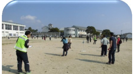
Gゴルフ（スポーツ・文化部会）