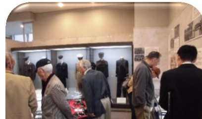
県警本部視察（防犯・安全部会）