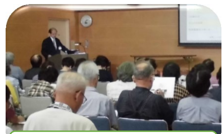
認知症講話（健康・福祉部会）

協議会は、総会 1 回、代表者会議 3 回、役員と区長懇談会 2 回、役員会 9 回を開催して、協議会活動の要となる役員・区長・部会長及び副部会長等が議論を重ねて諸事業に積極的に取り組んできました。