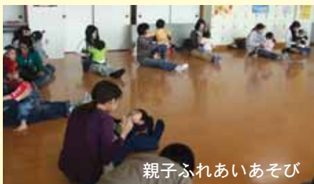
親子ふれあいあそび