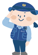
小郡警察署管内の犯罪・交通事故の発生状況 (令和6年1月末現在)