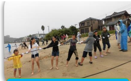
地引き網(青少年育成部会)