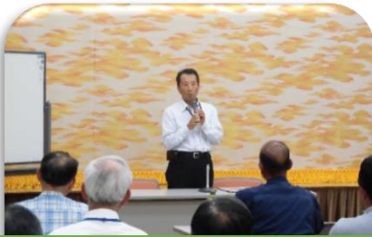
防犯安全講習会(防犯・安全部会)