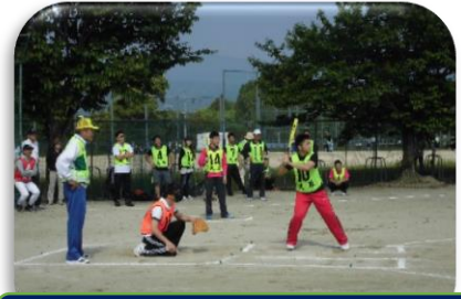
ソフトボール(スポーツ・文化部会)

協議会は、総会 1 回、代表者会議 2 回、役員会 8 回及び市長との意見交換会 1 回などを開催して、協議会活動の要となる役員、区長、部会長及び副部会長等が議論を重ねて諸事業に積極的に取り組んでいきました。