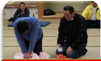
普通救命講習会(校区自主防災会)