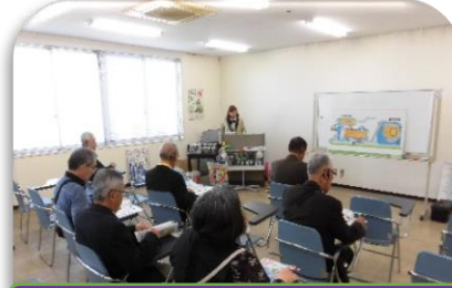
北九エコタウン視察(環境・衛生部会)