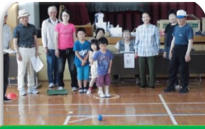
ペタンク大会(健康・福祉部会)

各組織の取組を集計すると、会議等 63 回(昨年 52 回)、事業 17 回(昨年 19 回)、参加者は 1,096 人(延・昨年 1,251 人)となっています。