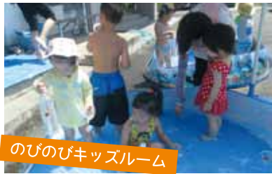
のびのびキッズルーム