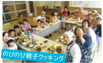
のびのび親子クッキング