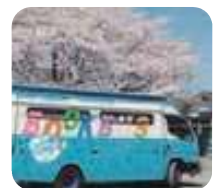
移動図書館車しらすぎ号