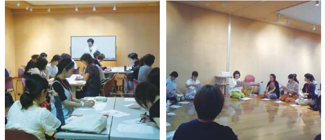
～令和元年度講座の様子～

問合せ先 子ども育成課 小郡255-1(北別館1階) ☎72-2111(内線673) 【E-mail】syogai-katei@san.bbiq.jp