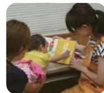
ブックスタートの様子