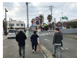
まち探検の様子。インスタントカメラと地図を持って、歩きました