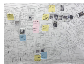
地図上に探検結果をまとめました