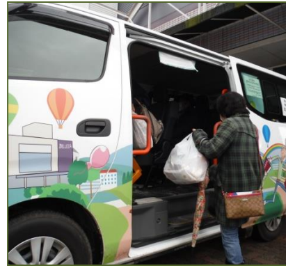
利用者の乗車（三国が丘駅）