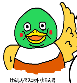
けんしんマスコット・カモ君

知った？特定健診は約8,000円かかるとよ。自己負担金500円で受けれるって超お得！