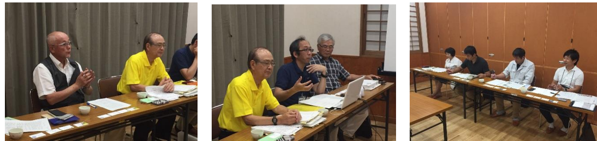
【6月30日大分県日田市議会（4名）からの視察の様子】

自治会バス「ベレッサ号」では、これまで全国からの視察や取材などが24回を数えるようになりました。最近、相次ぐ視察の対応でバタバタする状況が続いていますが、小郡市ののぞみ小校区の取り組みが、全国から注目されるようになって、遠くからも視察に来ていただけることは大変嬉しいことです。これからも、視察にお越しいただいた皆様に、「小郡市は素晴らしい！」と好印象を持って帰っていただけるよう、「お・も・て・な・し」の心で頑張ります。