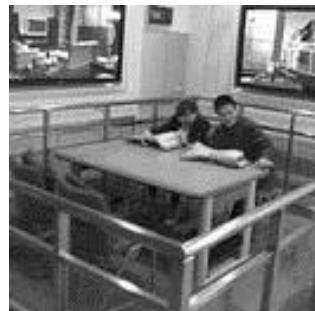
【福岡市防災センターでの地震体験の様子】

防災部会は、来年度に希みが丘区、美鈴が丘区合同の総合防災訓練を実施できるよう、本年度、自主防災組織の要となる両区の防災リーダーや区役員等を主な対象とした防災研修及び災害対応のイメージトレーニングを行います。防災研修では、災害の模擬体験ができる福岡市防災センター等の見学を行います。