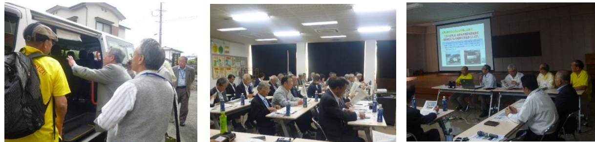
【5月8日福岡県古賀市区長会（50名）からの視察の様子】