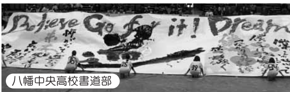
八幡中央高校書道部

「書道パフォーマンス甲子園」「書道ガールズ甲子園」出場の八幡中央高校が「中央旋風」を九歴に起こします！！