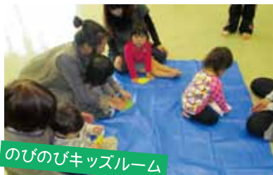
のびのびキッズルーム