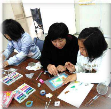
親子で共同作業☆ パステルアート