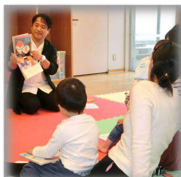
親子で聞く 読み聞かせ講座