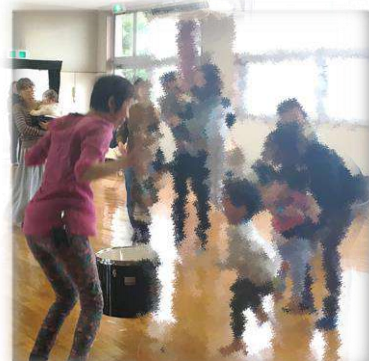
親子で楽しむ 音楽あそび