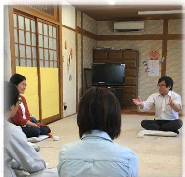
保護者の悩み相談 座談会