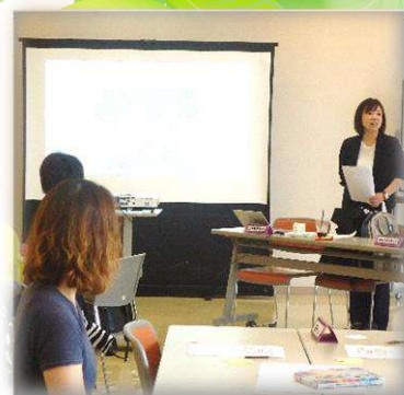
家族の笑顔 ～夫婦と家族～