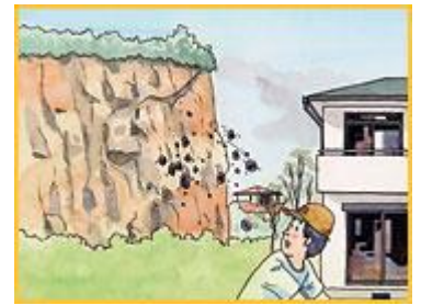
がけから小石がぱらぱらと落ちてくる。