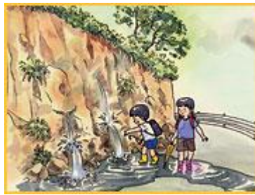
がけから水が湧き出ている。