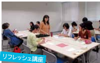
リフレッシュ講座