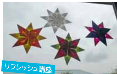
リフレッシュ講座