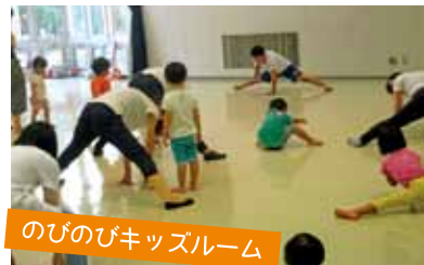
のびのびキッズルーム