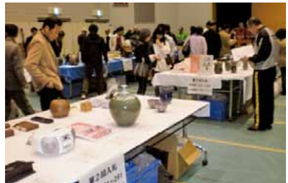
昨年の合同公売会の様子