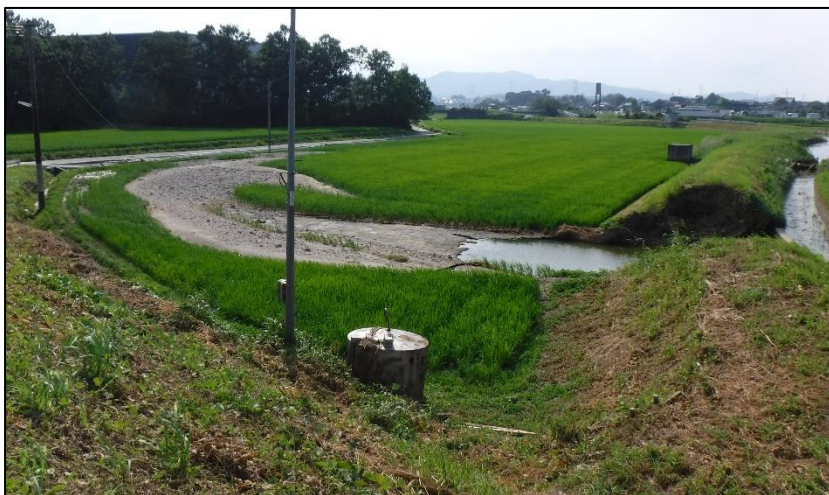
【左：干潟草場川破堤状況】