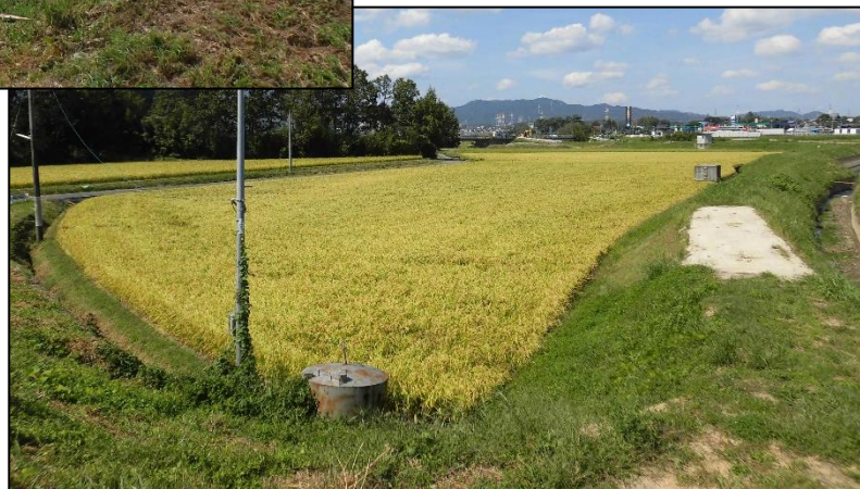
【右：災害復旧工事後】