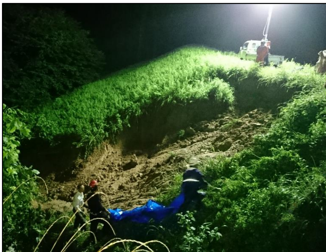
【左：上田町堤被災状況】