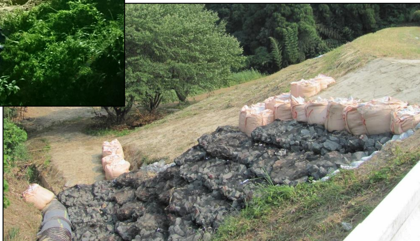
【下：災害応急仮工事後】