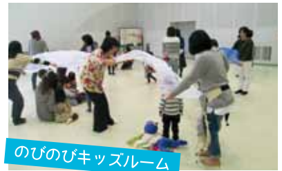
のびのびキッズルーム