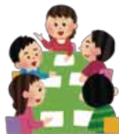
女性が地域社会のリーダーになるために必要なこと

男女ともに抵抗感をなくし、社会の中で評価を高める必要があると感じている人が多いことが分かります。意欲のある女性がリーダーとして活躍するためには、周りの理解やサポートが不可欠です。