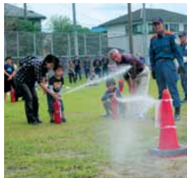
宝城団地避難訓練(平成23年10月2日)