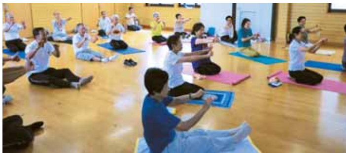
健康体操風景(三国が丘)

市民からは、健康リーダーの次世代育成のため講座の継続的開催を求める声や社会福祉協議会、地域包括支援センター、健康課で行われている類似事業を整理して欲しいという声が出されました。