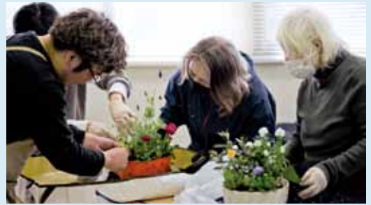
▲「花を中心にした人の輪づくり事業」松崎花壇部