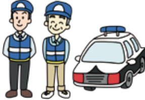
小郡警察署管内の犯罪および交通事故の発生状況 (7月末現在)

連絡会には、防犯協会会長(加地市長)、同副会長(大刀洗町長)らも出席し、活動の効果や今後の課題などを話し合いました。