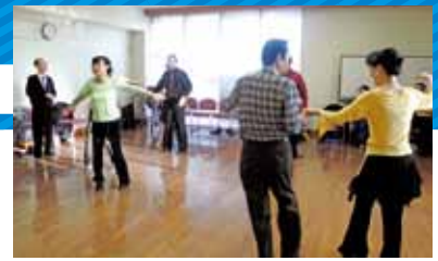
▲社交ダンス体験の様子