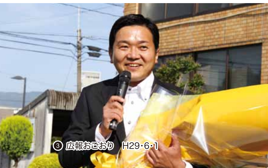
◀集まった市民を前に初登庁のあいさつをする市長

テーマは「つながるまち小郡」として、多様な市民がつながり、新たな地域力を生み出す、地の利を前面に九州各地とつながり、新たな活力を生み出す、小郡市のこれまで発揮されなかった隠れた可能性を引き出すことを考えています。(↓次ページへ)