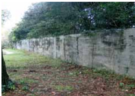
国立療養所菊池恵楓園 隔離壁跡