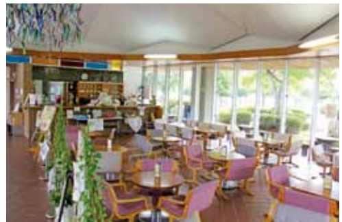
▲生涯学習センター コミュニティラウンジ