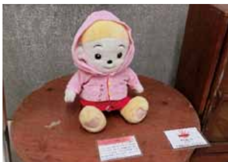
菊池恵楓園 社会交流会館展示品