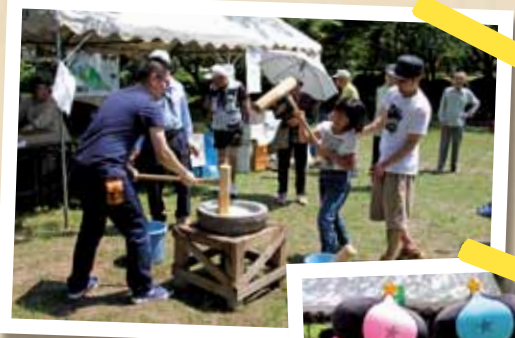
オリリンと ヒコリンもきたよ