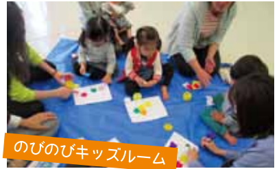
のびのびキッズルーム