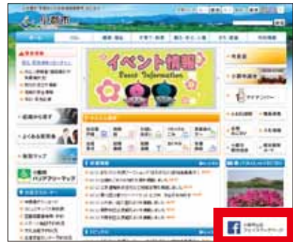
▲スマートフォンやパソコンから閲覧できます