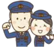
小郡警察署管内の犯罪および交通事故の発生状況 (2月未現在)

※詳細は、県警察本部警務課採用センター(☎092-622-0700)または小郡警察署へお問い合わせいただくか、受験案内をご覧ください