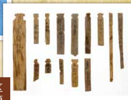
不丁地区 出土木簡