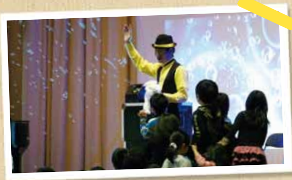
三国中学校地域ボランティア(2年生/撮影)

平安市長は、本郷基山線の開通で踏切事故の減少や交通アクセスが向上し、市のさらなる活性化につながると話しました。本郷基山線が開通したことにより、踏切周辺の渋滞緩和や歩行者の安全確保などが期待できます。