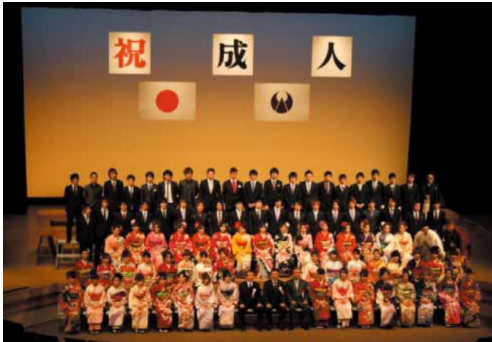
▲校区ごとに記念写真の撮影

●申込・問合せ先 生涯学習課社会教育係 ☎72-2111内線524 ファクス72-3828 Eメールshogai@city.ogori.lg.jp 〒838-0142 小郡市大板井136-1