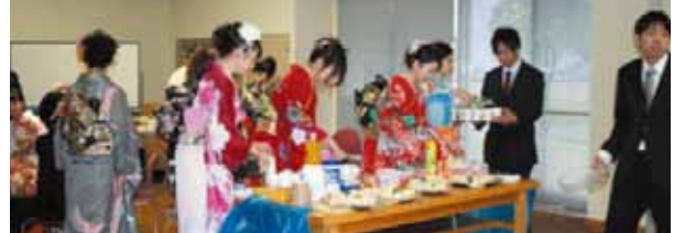
▲式典後の校区別交流会の様子