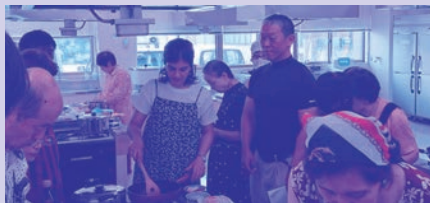
世界の家庭料理体験教室 講師の出身国の家庭料理を教 えてもらう体験教室です。

市民の皆さんに外国の文化を身近に感じてもらうために、日本に住む外国人の方を講師に迎え、年に数回、国際理解講座を開催しています。講座の詳細は広報おごおりやホームページでお知らせします。