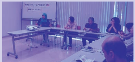
講演会 講師の出身国での暮らしや文 化を紹介してもらいます。

◆国際理解講座は、おごおり国際交流協会に委託し、実施しています。 おごおり国際交流協会は、国際文化交流活動を通じて市民意識の高揚と活気あるまちづくりをめざす民間団体です。国際理解講座の他にも、日本語教室や市民まつりへの出店、フレンドシップ交流会など国際理解を深める活動をしています。