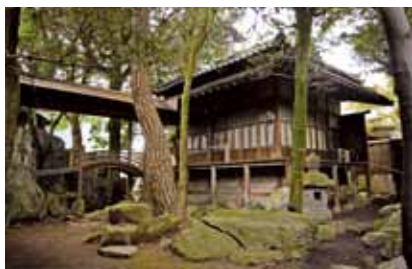
市指定文化財 平田家住宅

市長 ―小郡校区の皆様から、平田家を中心に様々なルートの開発や観光ガイドの育成などたくさんアイデアをいただきました。歴史資産を積極的に活かしていくこうとする市民の皆様やNPO法人の主體的な取り組みが大きな鍵となりますが、行政として積極的に支援します。