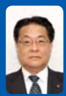
田中 雅光 (公明党)