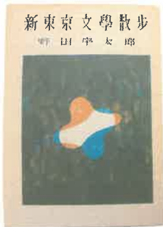
(左)取材時(昭和25~26年)に野田が使用していた手帳 (右)『新東京文学散歩』昭和26年 日本読書新聞

野田宇太郎の大きな功績の一つとして、「文学散歩」というジャンルを確立させたことが挙げられます。文学散歩とは、日本各地の文学にゆかりのある地を実際に踏査し、紀行文としてまとめたものです。野田の文学散歩は、ラジオやテレビで紹介されるなど、とても人気の作品でした。この文学散歩シリーズは、今から70年前の昭和26年に発行された『新東京文学散歩』から始まります。野田が「文学散歩」執筆にあたって収集した図書や資料を中心に、野田が「文学散歩」に込めた思いについてご紹介します。