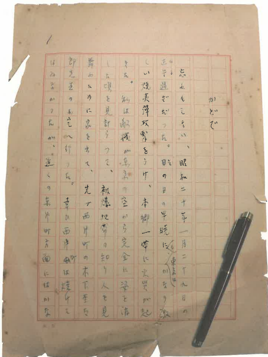
『新東京文学散歩』「かどて」野田自筆草稿・野田遺品の万年筆