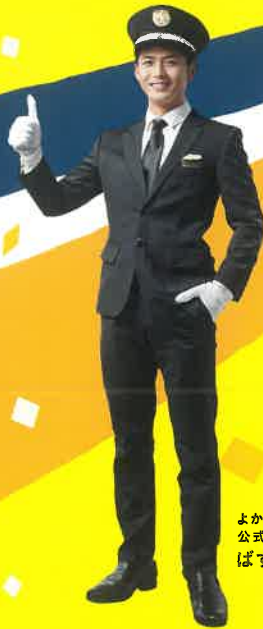
よかバス 公式アンバサダー(AI) ばすたび よかお