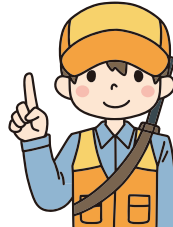
小郡警察署管内の犯罪・交通事故の発生状況 (令和7年8月末現在)