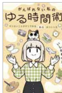
がんばれない私の ゆる時間術