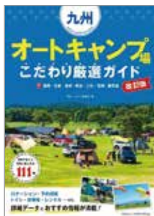
九州オートキャンプ場 こたわり厳選ガイド