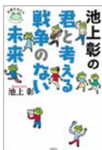
池上彰の君と考える 戦争のない未来