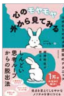
心のモヤモヤ 外から見てみる