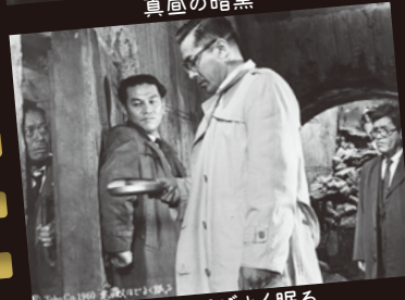
悪い奴ほどよく眠る