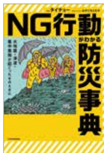
NG行動がわかる 防災事典