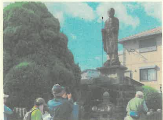
小郡市内での巡礼のようす