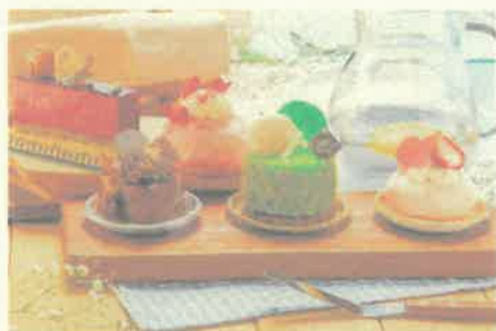
恋人の聖地PRスイーツ（イメージ）