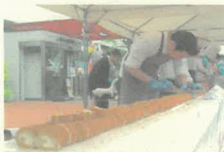
先着順で来場者へ配布

スイーツとグルメをテーマに、市内外の人気菓子店や飲食店が一堂に会し、自慢の味をお届けします。小郡市の「たなばた伝統の里」が認定されている「恋人の聖地」をイメージした限定ケーキのほか、春らしい華やかなスイーツや、各店こだわりの逸品グルメが勢ぞろい。見て楽しい、食べておいしいひとときをお楽しみいただけるイベントです。