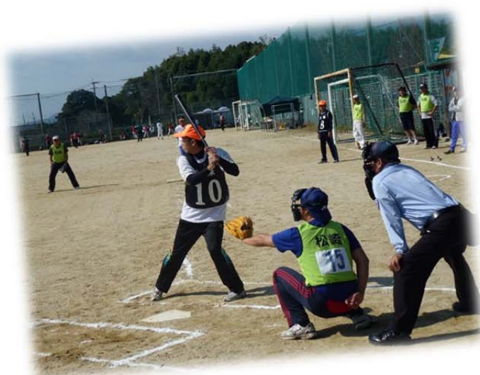
フェスティバル小郡 ソフトボール大会