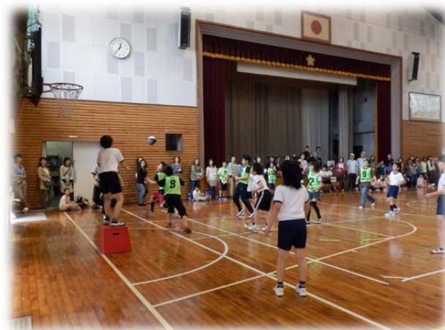
ジュニアスポーツフェスティバル ドリームボール