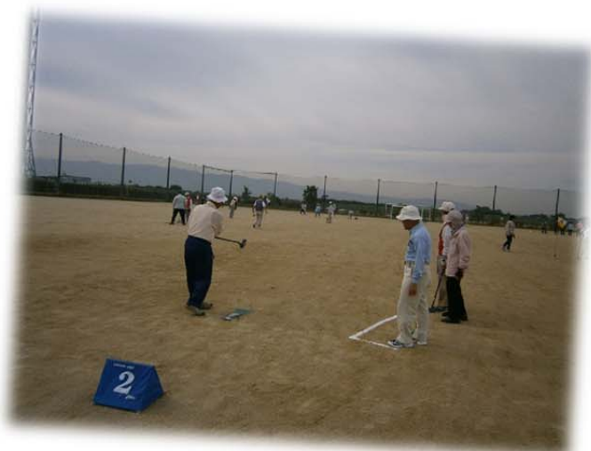
フェスティバル小郡 グラウンドゴルフ大会