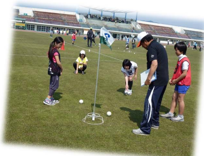
ジュニアスポーツフェスティバル セタハンドゴルフ