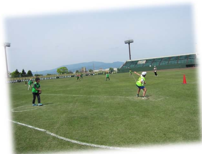
ジュニアスポーツフェスティバル スカイボール