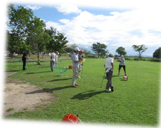
スポーツレクリエーション大会 ターゲット・バード・ゴルフ